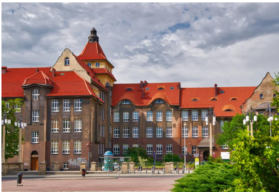
Instytut Biologii, Biotechnologii i Ochrony Środowiska

Oddajemy w Państwa ręce pierwszy numer biuletynu naszego Instytutu – wierzymy, że będzie się rozwijał i spełniał swoją informacyjną funkcję!