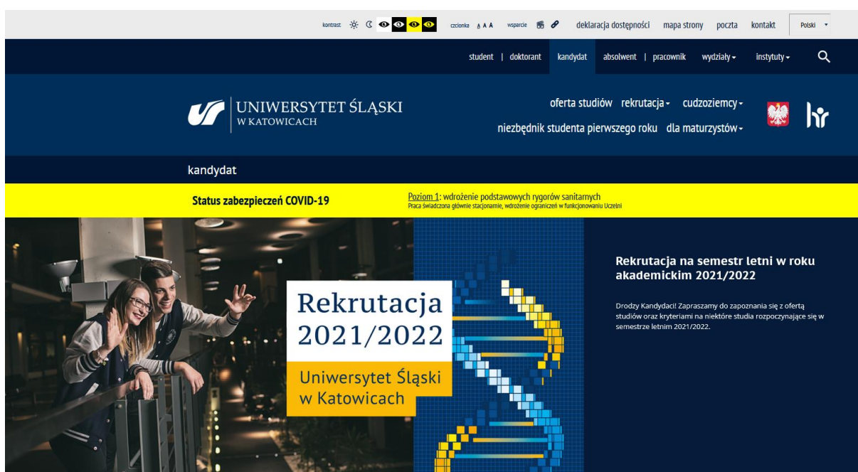
Ryc. 9.2. Strona internetowa dla kandydatów na studia

W zakładce student na stronie głównej Uniwersytetu Śląskiego umieszczone są informacje interesujące całą społeczność studencką Uczelni jak: bieżące wiadomości studenckie; Komunikaty; Nadchodzące wydarzenia; przekierowanie do systemu obsługi studenta USOS; Kontakty do m. in. Centrum Obsługi Studentów, Działu Kształcenia, dziekanatów, koordynatorów dostępności na wydziałach; łącza do Mediów akademickich; Multimedia oraz Helpdesk umożliwiający zadanie pytania, na które student nie znalazł odpowiedzi na stronie. Dodatkowo znajduje się odnośnik do strony www.zdalny.us.edu.pl , która powstała w związku ze stanem pandemii COVID-19. Zamieszczone są tam najważniejsze komunikaty i zarządzenia związane z przejściem w zdalny tryb nauczania. Studenci mogą tam znaleźć informacje dotyczące organizacji kształcenia i funkcjonowania uczelni.