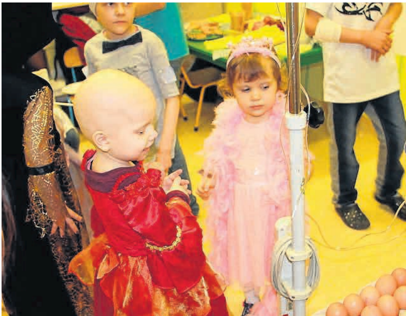
► Dzieci nie mogły przyjechać na WIEŚ PARTY, to impreza przyjechała na oddziały w Katowicach i Zabrze. Wolontariusze przygotowali istic wiejskie zabawy. Najbardziej podobał się wyścig jajek, i wbrew pozorom, wcale nie było łatwo pobijać kolejne rekordy!