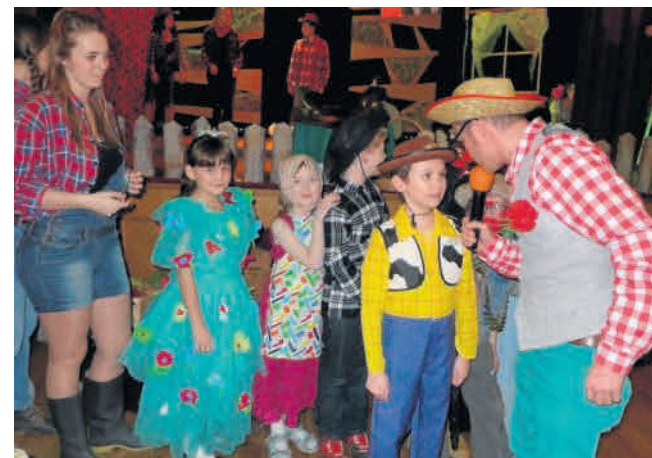
► Na oddziałach onkologicznych nie brakuje też imprez karnawałowych i kolorowych przebrań