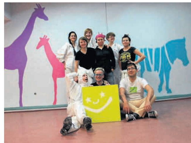
► 15 stycznia zespół fundacji malował zwierzątka na ścianach Oddziału Ratunkowego w Górnośląskim Centrum Zdrowia Dziecka