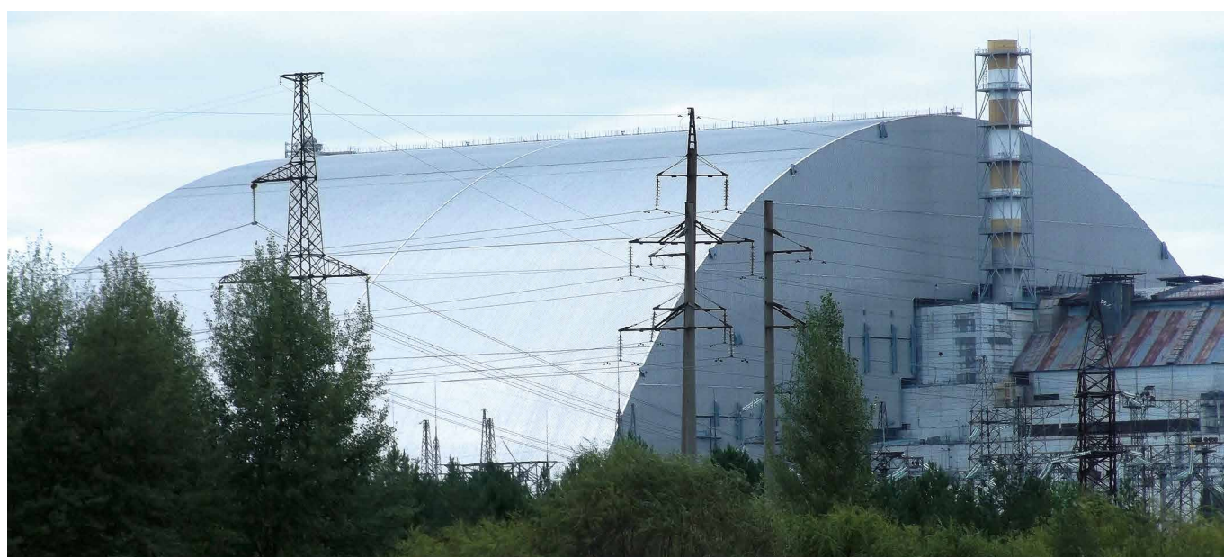
Sarkofag osłaniający pozostałości zniszczonego reaktora w czarnobylskiej elektrowni jądrowej

Energia pozyskiwana przy udziale paliwa jądrowego niesie za sobą wiele zagrożeń, lecz ma również szereg bezspornych zalet. Na pewno mocną stroną energii jądrowej jest jej niskoemisyjna produkcja, choć niestety procesy związane z wydobyciem paliwa, budową reaktora i składowaniem odpadów radioaktywnych już nie. Rzeczywiście rozszczepienie jądrowe jest źródłem ogromnej energii, w związku z tym elektrownie jądrowe charakteryzują się bardzo niewielką powierzchnią w przeliczeniu na jednostkę wytwarzanej przez nie energii. Energia jądrowa ponadto jest stabilnym i wydajnym źródłem energii, niezależnym od warunków pogodowych. Sami musimy rozważyć, czy zalety przewyższają wady i jakie są konsekwencje zarówno korzystania z energii jądrowej, jak i trwania przy tradycyjnych źródłach.