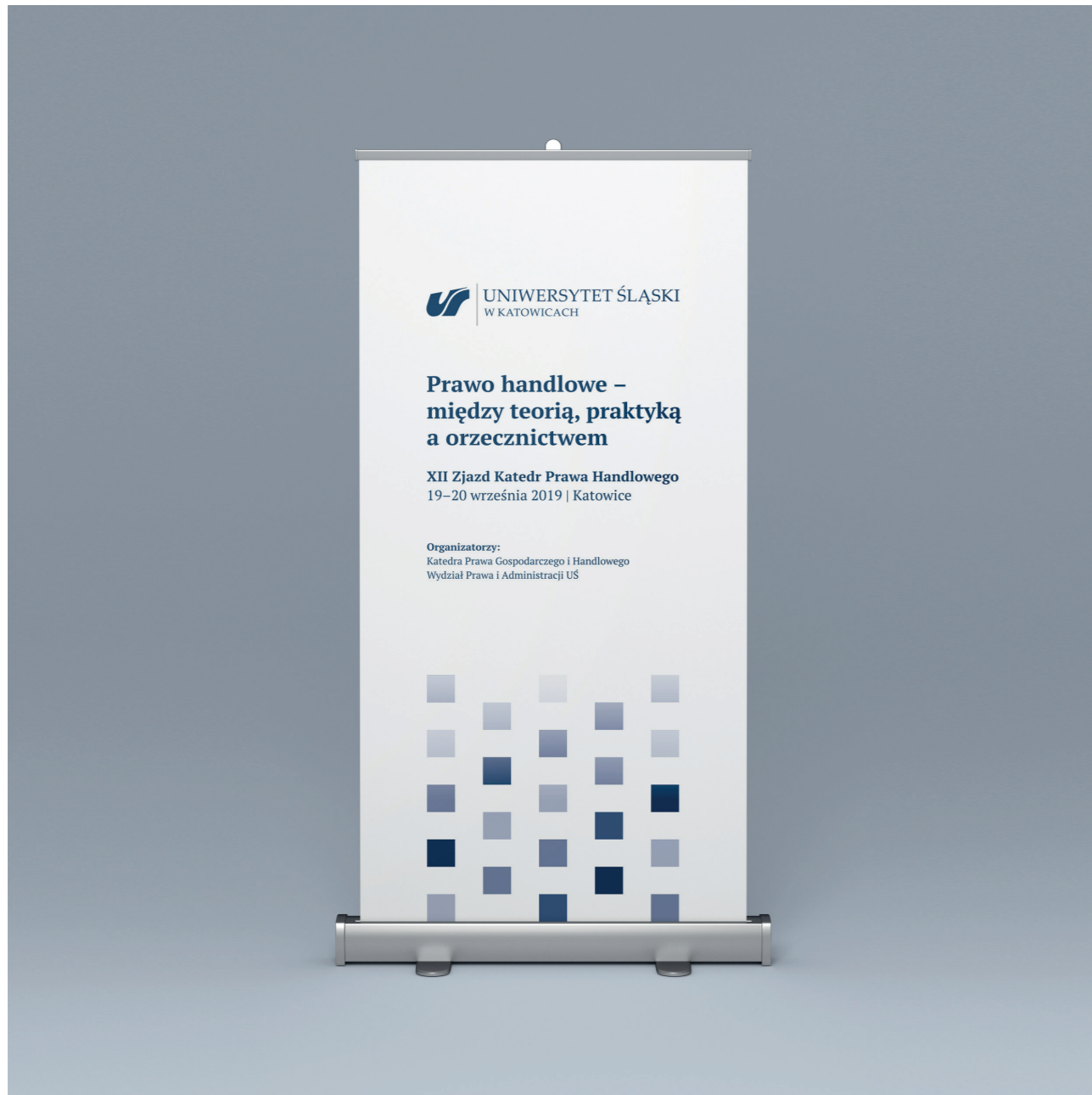
Przykładowy roll-up wydarzenia